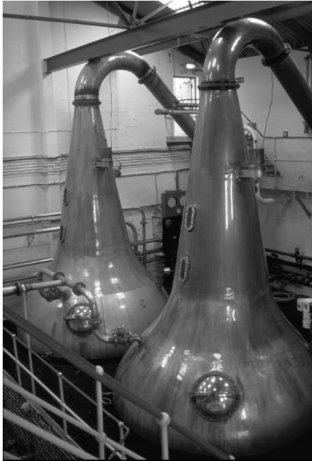
Brennblasen - Lagavulin